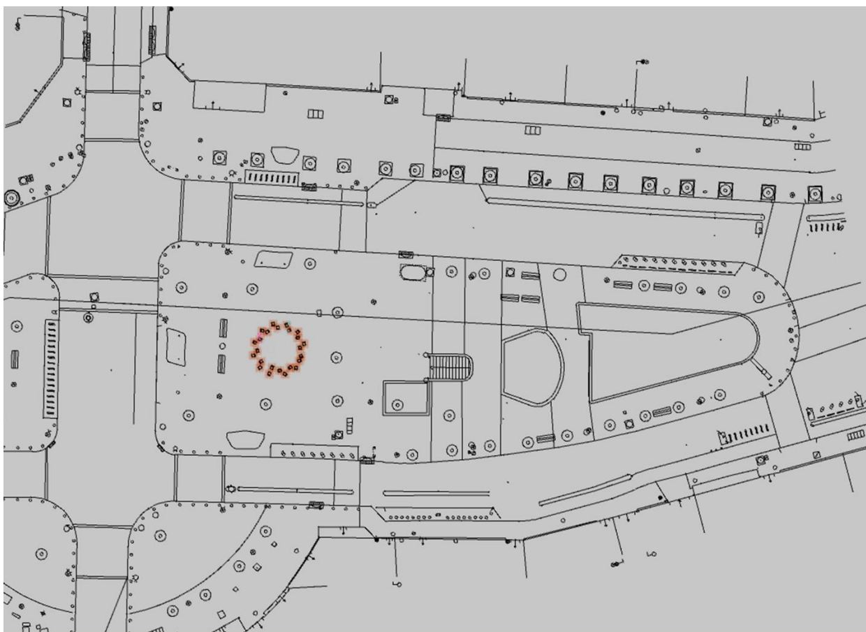
Insertion dans l'espace