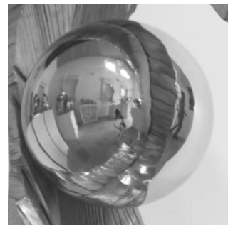
Finition poli miroir