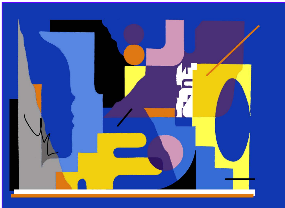
Mise en situation — Mur gauche