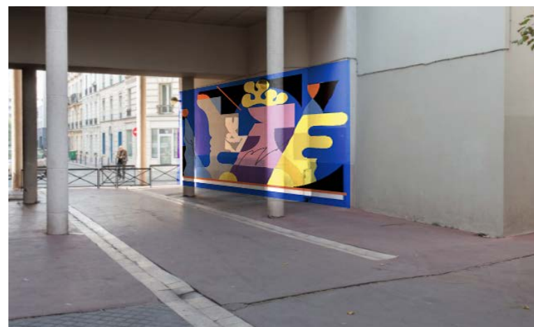
Mise en situation — Mur gauche