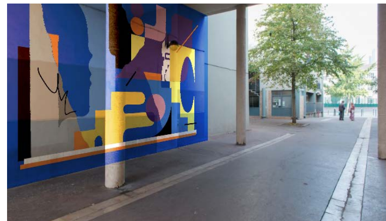
Mise en situation — Mur gauche

Ces éléments évoquent un langage, une écriture qui lui est propre, inspirés d'une diversité ethnique découverte lors de ses différents voyages, rêves et lectures. Ainsi, son style et sa démarche évoluent avec le temps, sans oeillères.