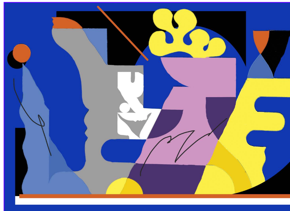
Mise en situation — Mur droite