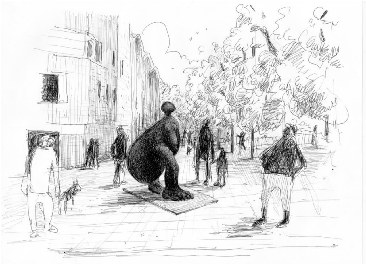
Dessin d'étude pour PASSANTE, place Carmen, Paris 20 ème