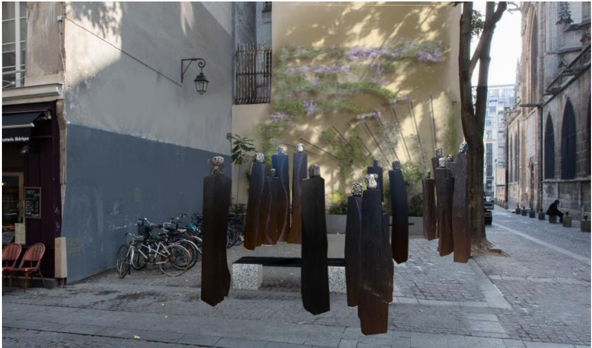
Photomontage vue d'ensemble Angle Saint-Martin / Cloître Saint-Merri

Ils sont là, silencieux et figés, debout, de jour comme de nuit, bravant toutes les humeurs du temps.