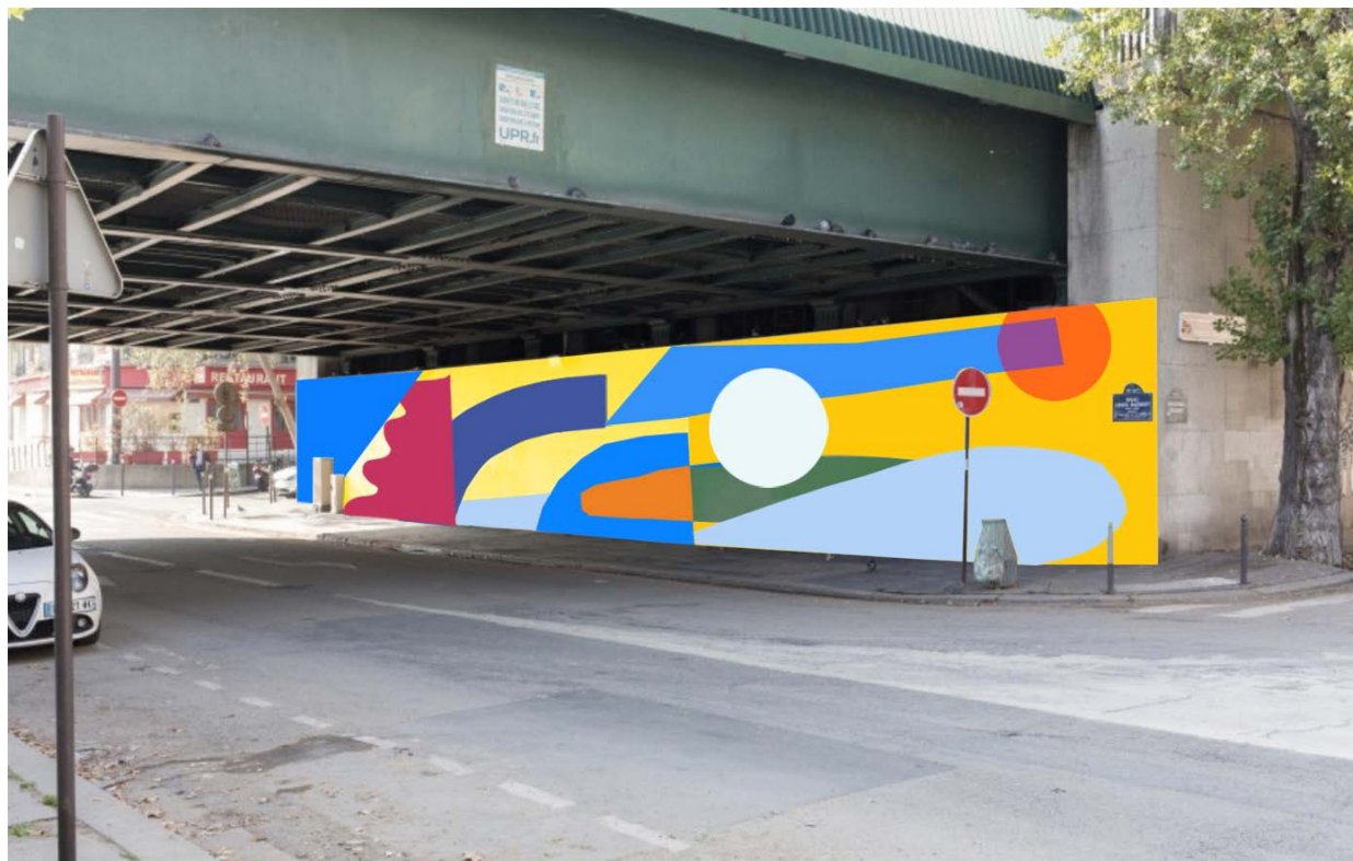
Mise en situation — Proposition artistique n° 1

A l'échelle du piéton, elle est perçue comme une vague de couleurs sous le pont qui accompagne ce dernier dans sa déambulation quotidienne. Les formes rondes et leur dynamique créent une atmosphère gaie et rassurante.