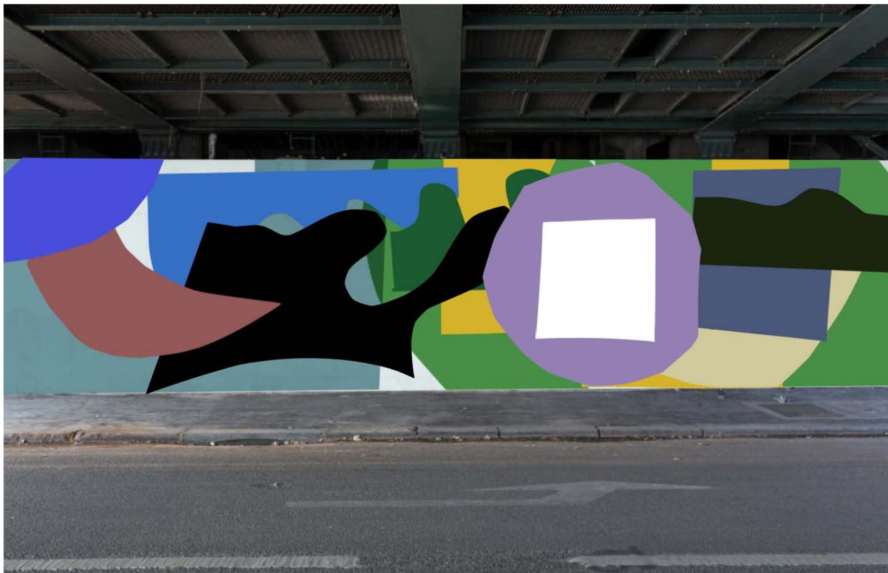
Mise en situation — Proposition artistique n° 3