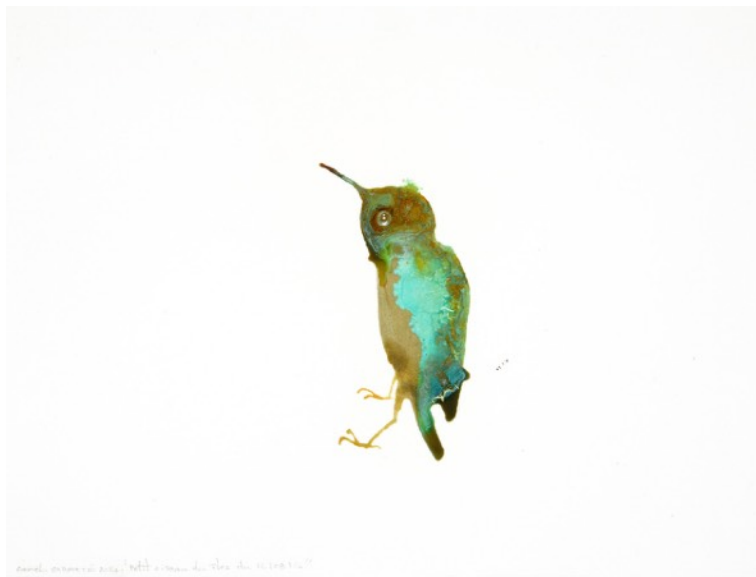
Lionel Sabatté, Petit oiseau des îles du 12-08-14 , Oxydation sur papier, 31 x 41 cm, 2014