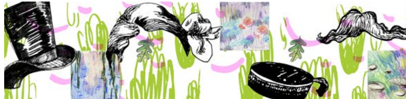
Technique : fresque et crédence en faïence décorées et émaillées à la main Thème : évocation des premiers déplacements des franciliens depuis la gare Saint-Lazare vers les plages normandes et de Monet partant à Giverny par les plantes qui rappellent les nymphéas.