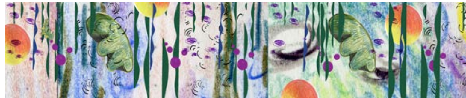
Technique : fresque et crédence en faïence décorées et émaillées à la main Thème : inspiration des Nymphéas de Monet