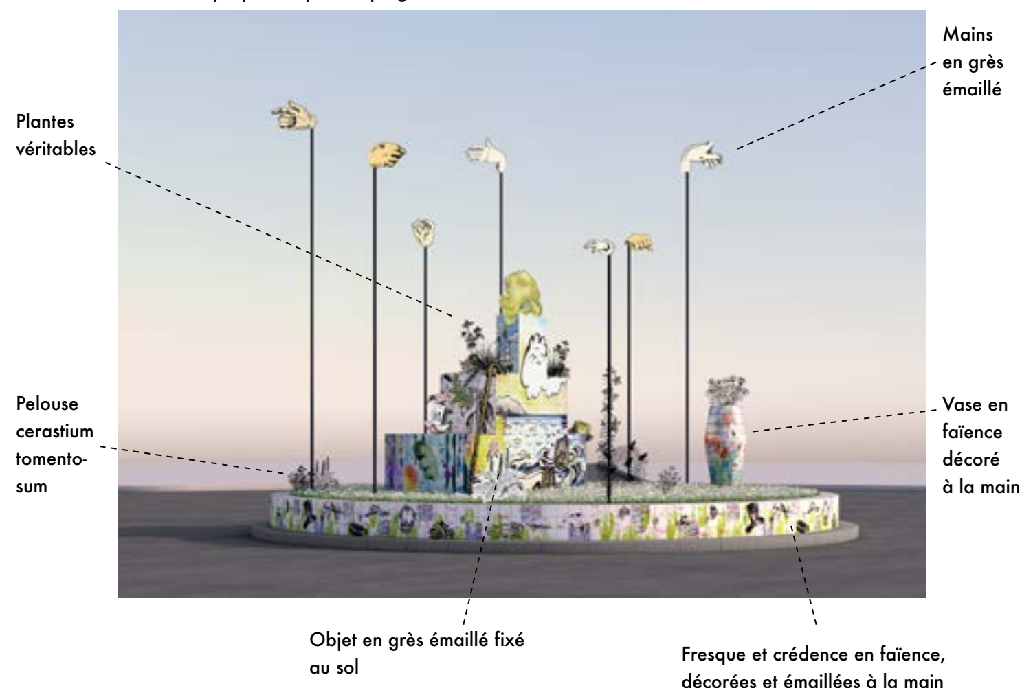
Vue 3D du projet Europe à la plage