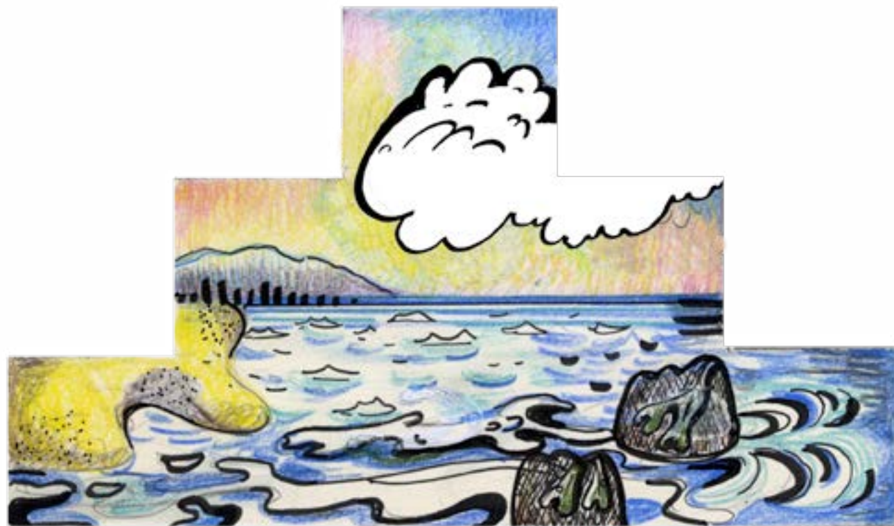
Technique : fresque et crédence en faïence décorées et émaillées à la main Thème : la face plate du podium est une évocation de l'Enlèvement d'Europe rappelant l'origine mythologique du nom de notre continent