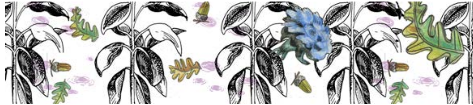
Technique : fresque et crédence en faïence décorées et émaillées à la main Thème : essences de la flore présente dans les peintures de Manet